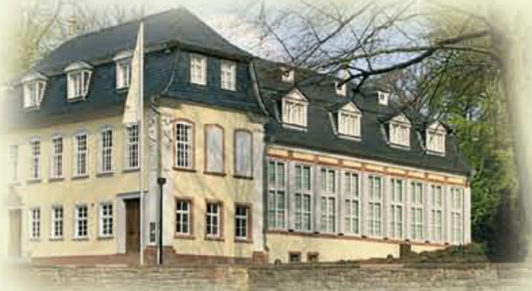
Wertheim, Schlosschen im Hofgarten